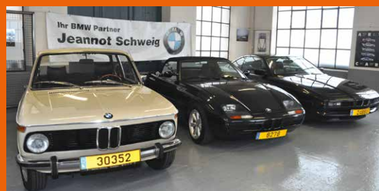
2002 Automatik, Z1 und 840i Coupé