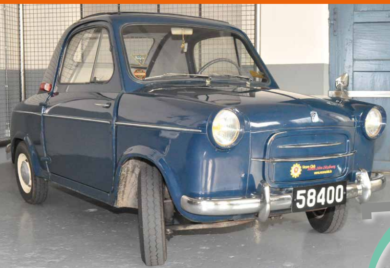
Es wurden über 30.000 Exemplare der Vespa 400 hergestellt

Insgesamt werden knapp zwei Dutzend Vespas ausgestellt; hinzu kommt noch die « Green Hornet »; die Renn-Vespa des VCRL, das Dreirad Ape Ac4, sowie die Vespa 400, das Auto aus den späten 1950er-Jahren. (r.h.)