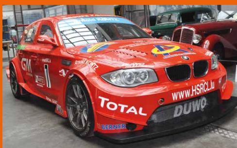
Der Rennbolide 1M GTR von DUWO-Racing

BMW aus der Gründerzeit und den Wirt- schaftswunderjahren ; Dixi DA 1-15 PS, Isetta 250 Export und R50