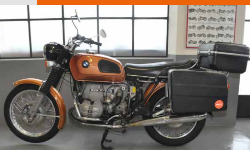
Die « Gummikuh » R75/5